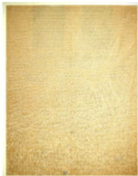
Archivo de Literatura Oral Colección Alamiro de Ávila