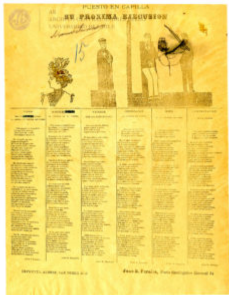
Colección Lira Popular de la Universidad de Chile