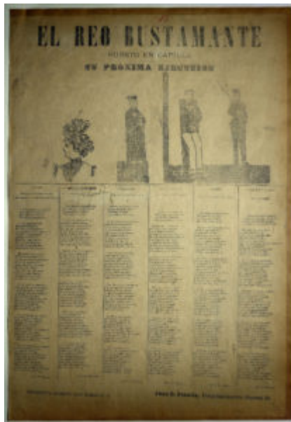
Archivo de Literatura Oral Fondo Rodolfo Lenz