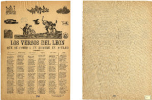
Archivo de Literatura Oral Colección Alamiro de Ávila