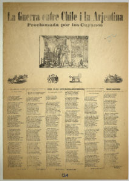
Archivo de Literatura Oral Colección Alamiro de Ávila