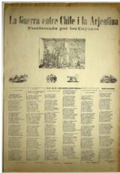
Archivo de Literatura Oral Fondo Rodolfo Lenz